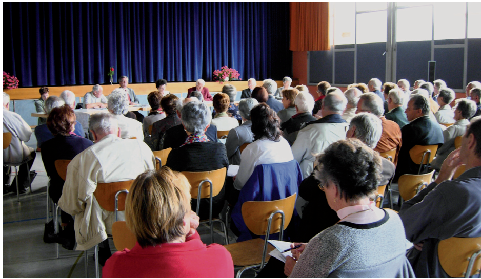
Belle participation à l'AG de Savièse