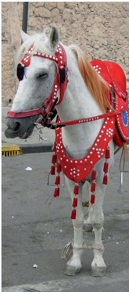
Regardez bien l'animal, l'homme lui impose parfois l'immobilité Auch der Mensch zwingt Tiere zur Immobilität

> Im Vergleich zu anderen Gruppen der Bevölkerung und besonders hierzulande, laufen oft Personen eines gewissen oder eines bestimmten Alters doppelt Gefahr zu Immobilismus und zu Immobilität. Die beiden verwandten Begriffe decken nicht gleiche Deutungen