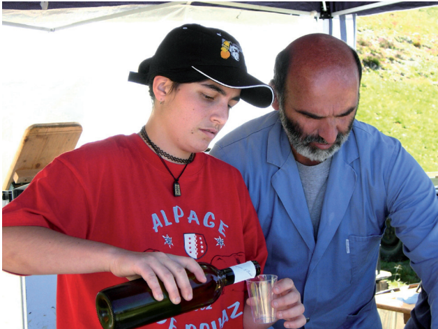
Katia ne coupe jamais le vin

➤ Le Simplon est une région riche en légendes et en contes. Beaucoup de légendes tournent autour du trafic par-dessus le col. En montant le Simplon à partir de Brigue se trouvait une auberge au lieu dit zer Taferna. Dans cette auberge, une femme était la patronne et pour améliorer le revenu elle coupait le vin avec de l'eau. Après sa mort, Dieu la punit. Elle doit demeurer pour toujours dans les eaux du ruisseau « Kalte Wassern » (eaux froides). Et la nuit les touristes peuvent entendre le chant de la patronne :