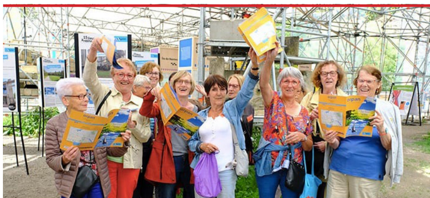
Treffen mit dem ORPAN in Nantes - der Vereinigung der Senioren, die Bürgerhilfe erhalten.

Die Stadt New York bietet als solche, zielstrebigere Strukturen. Sie adaptieren sich an ihre Persönlichkeit, ihre Krankheiten, ihren Altersstatus. „Sie sind nicht dieselbe Person von 65, 70 oder 90 Jahren. New York nimmt Rücksicht darauf. Sie behält sie zuhause, solange als möglich, sichert die Überführung in eine medizinische Klinik. Es gibt eine echte spezifische Versorgung. Dies ist auch möglich durch eine starke gemeinschaftliche und religiöse Haltung. Sie benötigt